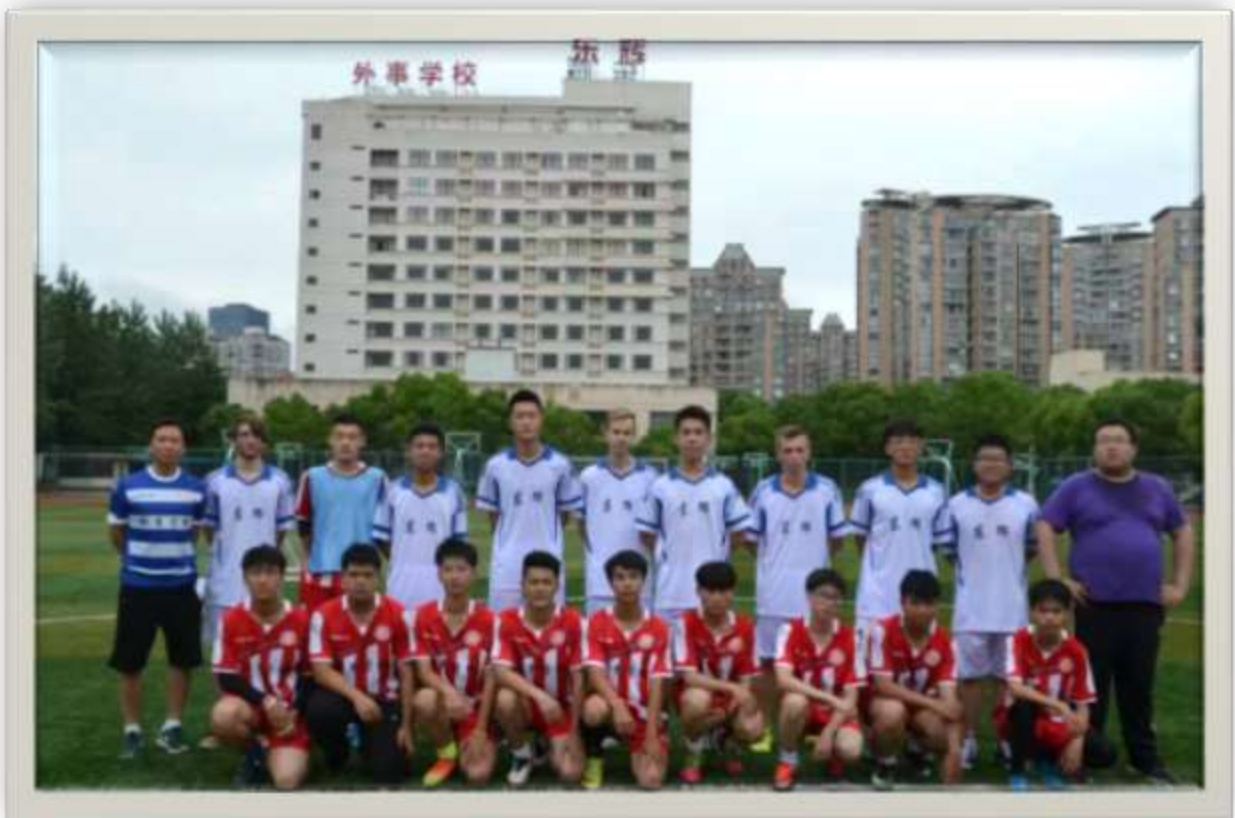
Die Schulmannschaft (rote Trikots) der Foreign Affairs Services School und die Schüler der Projektgruppe (weiße Trikots)